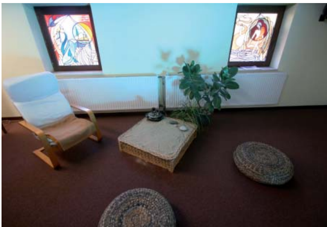
Salon de méditation (en haut de la chapelle)

Forts de la sagesse des grands ermites rompus à des années de pratique, nous répétons simplement ce qui se dit d'un apprentissage de la poustinia.